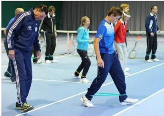
Übungen mit dem Rubber-Band

Broschüre „Fit in 5 Minuten – Übungen mit dem Rubber-Band“. Mit 6 Übungen für ein effektives Ganzkörpertraining.